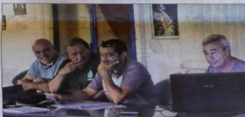
Les membres du bureau d'A Punta Bunifazinca ont exposé à la population les projets pour redynamiser la vallée du Cavu.

Nouveaux sentiers de randon- née, parcours patrimoniaux, ac- tivités sportives diverses, réha- bilitation de pistes, organisa- tion d'événements, etc. Le but étant de relancer une véritable dynamique dans la vallée du Ca- vu et du massif de San Martinu. Apporter, via des actions concer- tées, une plus value à la région et lui offrir de nouvelles perspec- tives d'avenir. Parce qu'elle le vaut bien... Nadia AMAR namar@corsematin.com